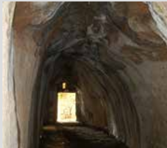
La grotte et le fournil. The cave and the bakehouse.

Every Wednesday during the school holidays, do not miss the discovery and creation workshops !