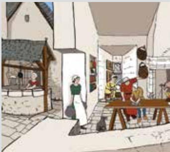
Des contenus et des livrets de visite adaptés à toute la famille. Content and tour booklets adapted to the whole family.