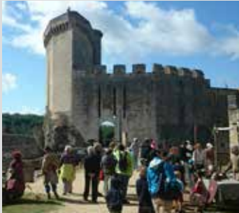
Le donjon et la vue depuis son sommet. The dungeon and the view from de top.

Tous les mercredis pendant les vacances scolaires, ne manquez pas les ateliers découverte et création !